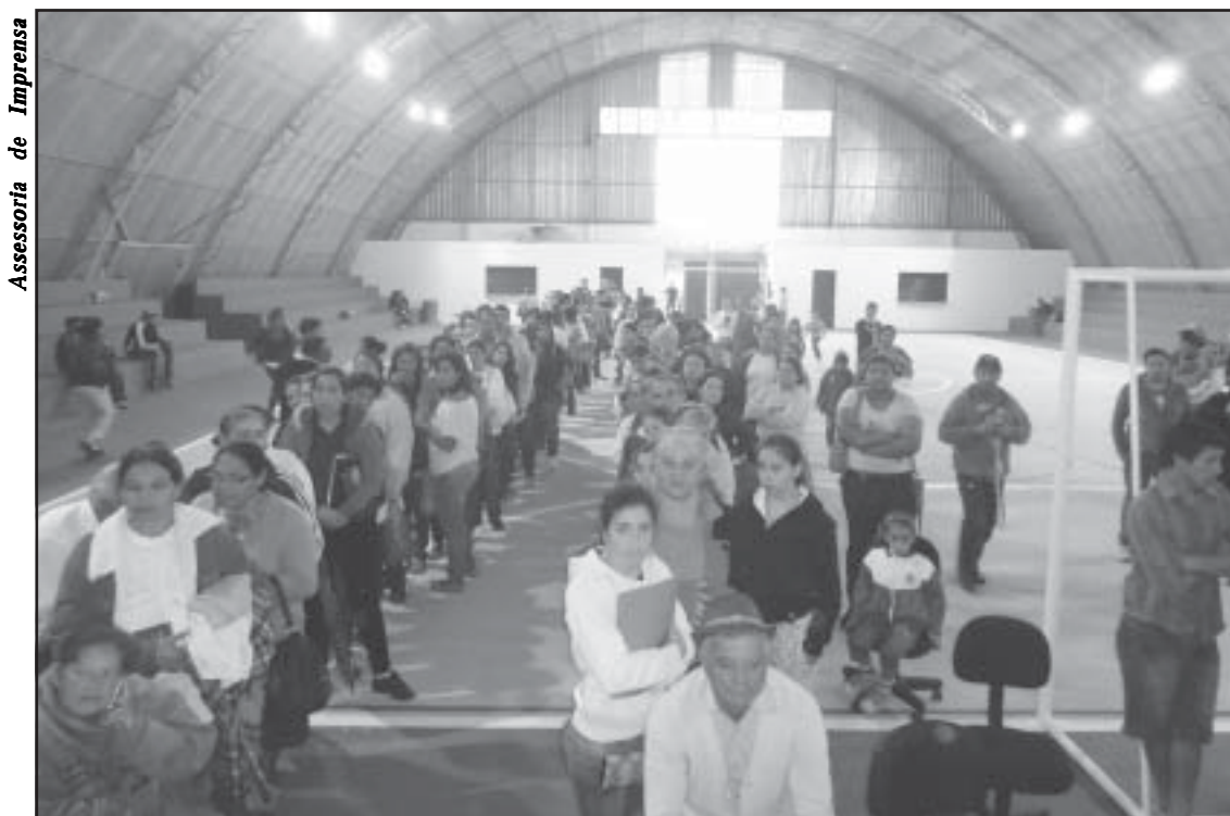
Ginásio do Turvo ficou lotado de pessoas interessadas em ganhar uma casa da CDHU

A CDHU ainda não informou a data do sorteio das casas, mas assim que a Prefeitura receber o comunicado será feita a devida divulgação.