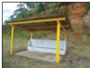
Ponto do Turvo