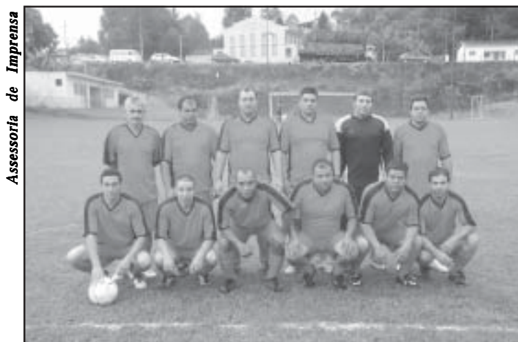
Assessoria de Imprensa