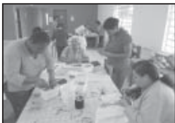
Além da capacitação, curso promove novas amizades

O curso de Patchwork é realizado por voluntárias, no espaço que pertence e é gerenciado pelo Município de Tapiraí. As aulas acontecem toda segunda e quarta-feira, no período da tarde.