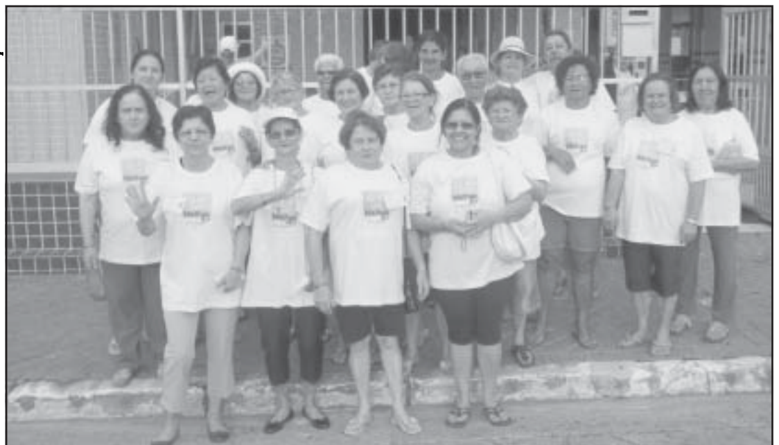
Grupo da Melhor Idade aproveitou os dias em Praia Grande com muita alegria e diversão