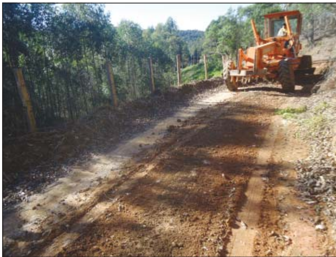
O bairro do Claros foi um dos atendidos com melhorias nas estradas municipais