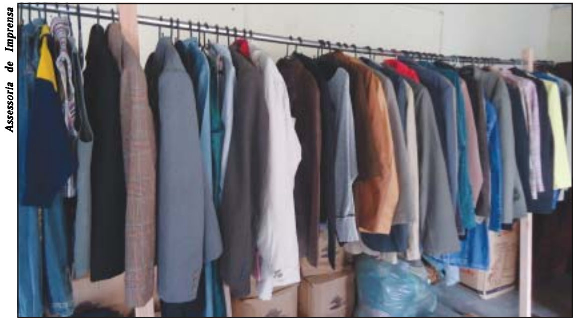
Casacos, vestidos, calças, sapatos, bolsas e mochilas estão a venda no Fundo Social com ótimos preços

O Bazar está localizado dentro do Fundo Social e funciona todos os dias, das 9h às 16h.