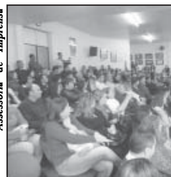
Assessoria de Imprensa

Duas etapas do processo já foram concluídas, que são a