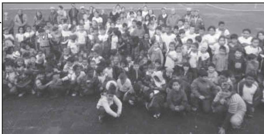
O Dia do Desafio reuniu crianças, jovens e adultos na programação