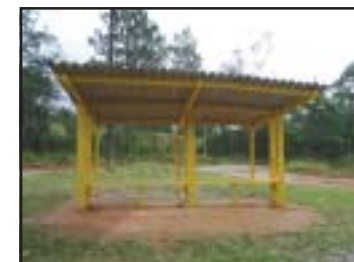
Ponto do Cristo Rei