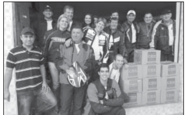
Moto Clube Free Bikers dando exemplo de solidariedade ao próximo

O Fundo Social de Solidariedade recebeu a doação de 10 cestas básicas do Moto Clube Free Bikers. A entrega aconteceu no sábado, dia 22, e contou com a presença de vários membros do grupo, da presidente do Fundo Social e demais autoridades municipais. O Fundo Social de Tapiraí agradece a doação. "Nossas famílias tapiraíenses ficarão muito gratas com essa nobre atitude. Obrigado", disse a presidente.