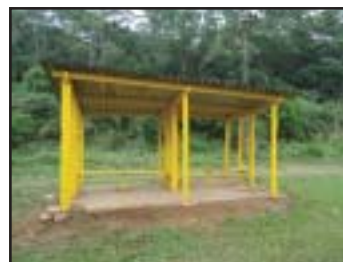
Ponto do Juquiazinho