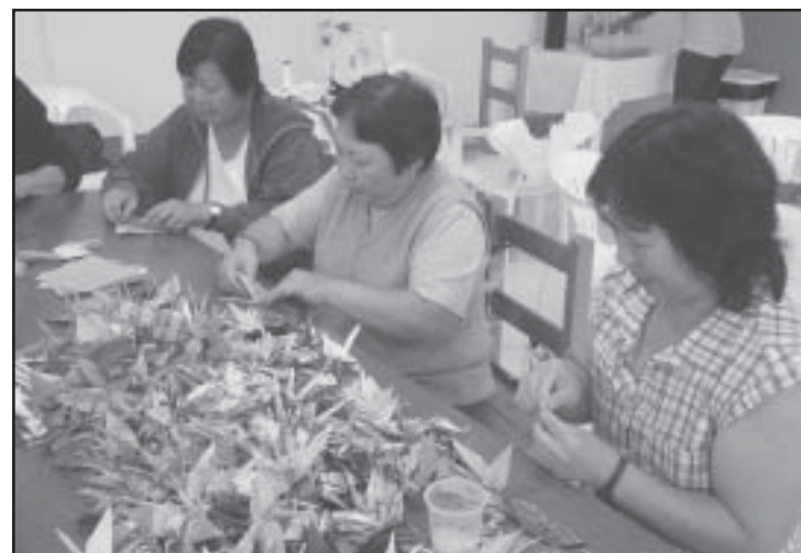
Alunas dos cursos de Patchwork e Tsuru