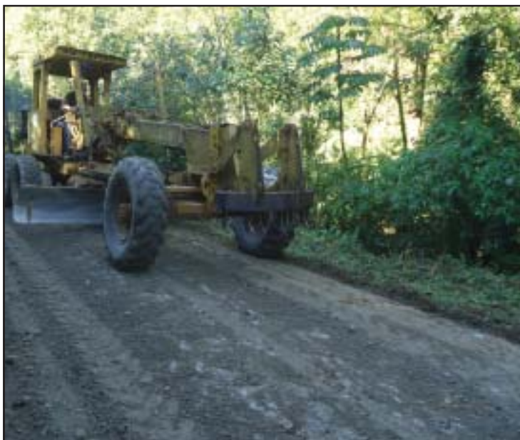
As máquinas também passaram no bairro Chá, lá foram colocadas pedras e feito limpeza nos acostamentos

Além da raspagem do solo, os funcionários fazem a sangria nas estradas para escoamento de água e para evitar erosão, depois são colocadas as pedras e, por último, a compactação. “Assim o trabalho fica de boa qualidade e tem mais durabilidade”, explicou o responsável pelo setor.