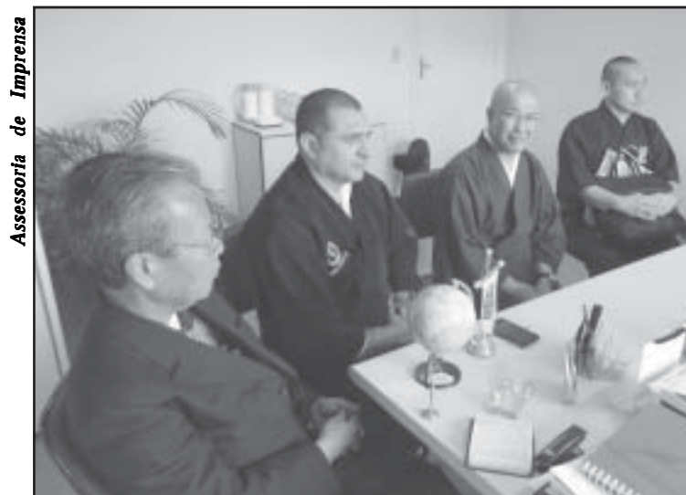
Sorrindo, o vice-secretário do Budismo Mundial, cardeal Nishimura

A Prefeitura se colocou a disposição para ajudar no que for necessário e no que estiver ao alcance. “Estes eventos trarão muitos turistas para conhecer nossa cidade, que é rica em belezas naturais e ficaremos muito gratos por isso”, disse.