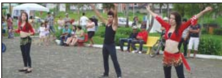
O grupo Cultura Viva se apresentou no 1º Domingo na Praça

Crianças, jovens e adultos poderão se inscrever