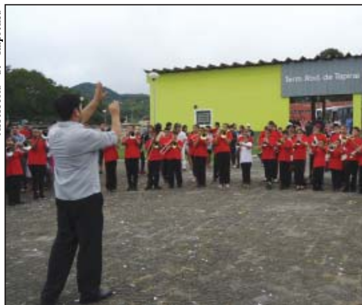
Banda Marcial de Tapiraí encerrou o evento com chave de ouro