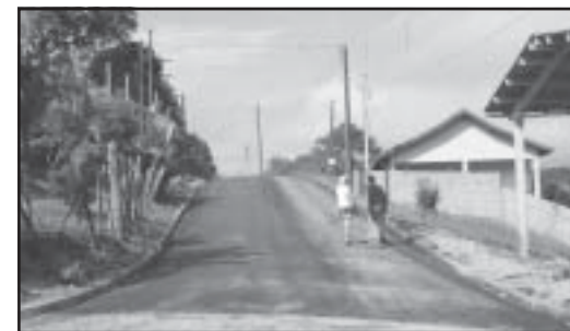
Rua Julio Alberto Maciera concluída