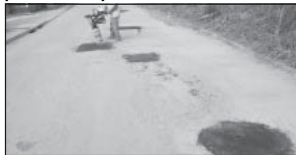
Tapa-buracos na Av. Nadia Mincovschi

necessária devido a reivindicação dos moradores locais, que sofriam com alagamento e invasão de águas em suas residências. Com a nova tubulação e a limpeza este transtorno foi solucionado.