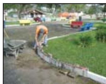
Guias estavam quebradas e foram arrumadas recentemente

pela Prefeitura, com a constante limpeza do local, bem como poda das árvores e gramado.