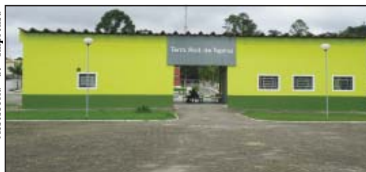
Acima, Rodoviária depois que recebeu a reforma. Abaixo, como estava antes