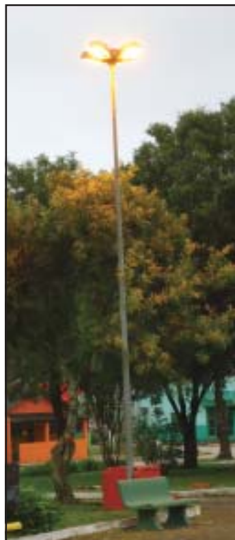
Assessoria de Imprensa

O coreto ganhou nova iluminação; luminárias foram instaladas no interior e na lateral do coreto, deixando o local mais bonito e seguro. As luzes dos postes também foram trocadas e será colocado, também, refletores sob as árvores, além da instalação de mais um poste de quatro pétalas.