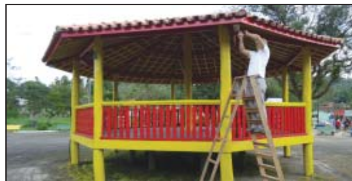
Playground será ampliado e, em breve, receberá novos brinquedos. Luminárias foram instaladas na Praça Central