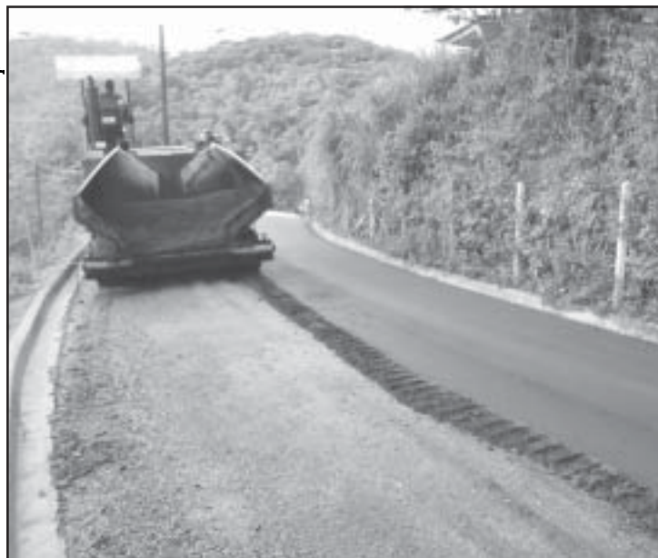
Rua Julio Alberto Maciera quando ainda estava em obras